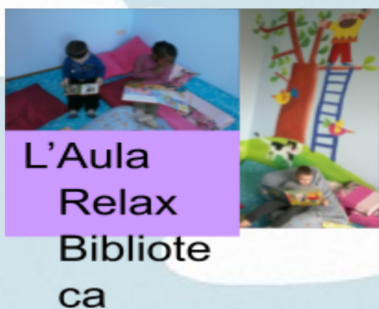
L'Aula Relax Biblioteca

L'ambiente e gli spazi sono accoglienti, curati, stimolanti, sicuri e a misura di bambino.